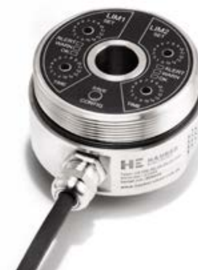
Serie HE2XX (geöffnet) mit Kabel