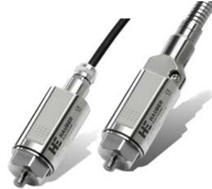
Serie HE10X mit integriertem Kabel bzw. Metallschutzschlauch (optional)