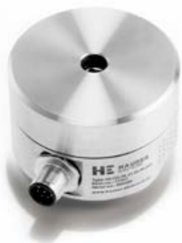
Serie HE2XX mit M12 Steckverbinder